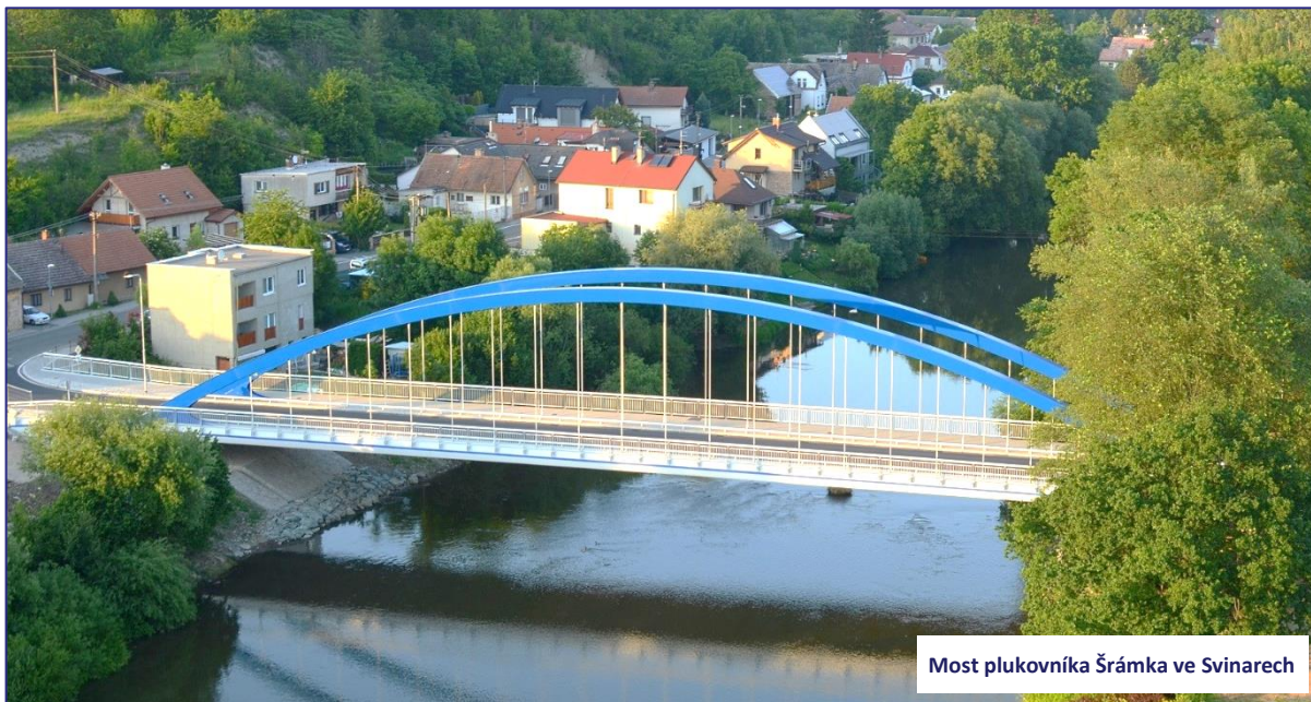
Most plukovníka Šrámka ve Svinarech

Dopravu v Královéhradeckém kraji chceme nejen udržet v současné kvalitě, ale chceme ji dále zlepšovat a rozvíjet, aby se postupně zlepšoval komfort cestujících nejen ve veřejné dopravě jako takové, ale zároveň v údržbě, opravách a investicích do krajské silniční sítě.