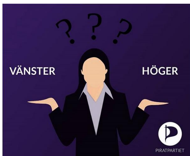
Ukázka z nedávné kampaně – ani pravice, ani levice.