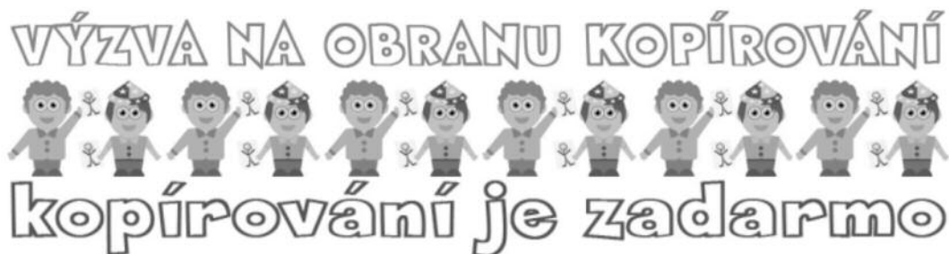
Obrázek 2. Ilustrace z webu ČPS.

Třetí tendenci představuje ústřednost technického pojmu kopírování pro celý slovník, což můžeme vnímat jako vyústění argumentace o diskontinuitě způsobené vývojem technologií. Celkově vzato je argumentace České pirátské strany protkána častými referencemi k technologiím, případně metaforami využívajícími technologických motivů – jako například v tvrzeních, že je potřeba restartovat systém , postoupit na další úroveň nebo upravovat parametry politiky . 39 Kopírování ale ostatní pojmy přesahuje svou významností, protože představuje proces, jenž s uplatněním digitálních technologií nabývá nového potenciálu, a dobře tak zapadá do vyprávění o diskontinuitě způsobené právě rozšířením digitálních technologií. Význam tohoto pojmu lze ilustrovat tím, že podle tohoto slovníku je ztotožnitelný s užíváním díla. Kopírování coby ústřední pojem je však podle České pirátské strany v běžném užití ztotožňován s pejorativním výrazem padělání . V tomto bodě však autoři nového pojmosloví očividně nenaráží na argumentaci České protipirátské unie, která, jak jsme viděli, ztotožňuje kopírování s krádeží , nikoli paděláním .