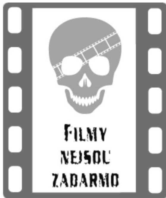
Obrázek 1. Logo kampaně Filmy nejsou zadarmo .

Česká protipirátská unie (ČPU) byla založena již v roce 1992 v reakci na problémy filmové distribuce, jež se podle dokumentů této organizace objevily právě počátkem devadesátých let. 12 V tomto zlomovém období totiž podle ČPU přestalo být kopírování videokazet „odbojem proti komunismu“ a začalo být „výhodným přivýdělkem“ a především „ekonomickým problémem“. Implikací takové argumentace je, že praxe kopírování se přenesla ze sporu disidentů s představiteli komunistického režimu ke sporu „šmelinářů a podnikavců“ s vydavateli filmů. 13 Vznik ČPU je tak těsně svázán s diskontinuitou, která se vyznačuje tím, že určitý druh distribuční praxe přestává být v polistopadovém období legitimní, protože ztrácí svůj politický rozměr a jeho důsledky začínají být vnímány především v rovině ekonomické.